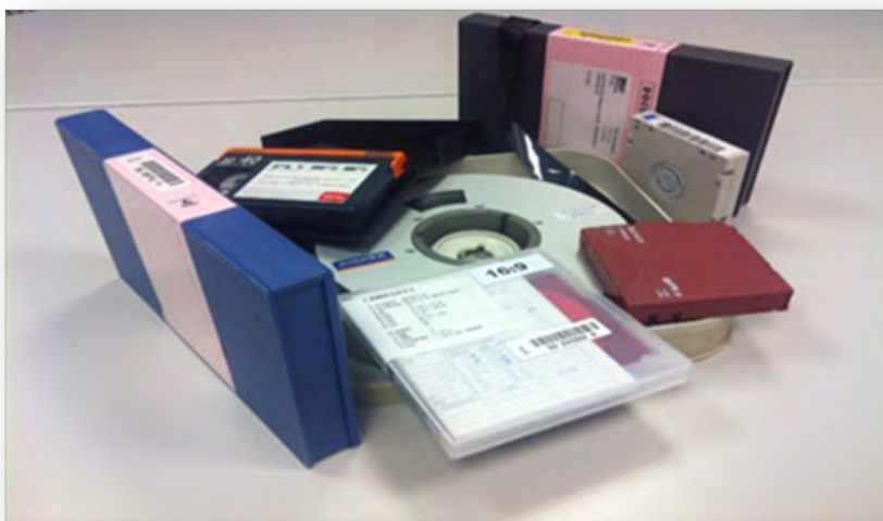
Diferents formats de video a l'arxiu de RTVV

Todos estos documentos son únicos, creados por este productor competente, de los cuales se pueden generar copias y distribuirlos a otras entidades. De la misma manera, por ejemplo, todas las producciones de RTVV es el fondo documental fruto de sus competencias (informativos, películas, documentales, etc.), donde han dejado constancia registrada en soporte de papel, cintas de video, soportes digitales, u otros, como resultado de su particular competencia y actividad.