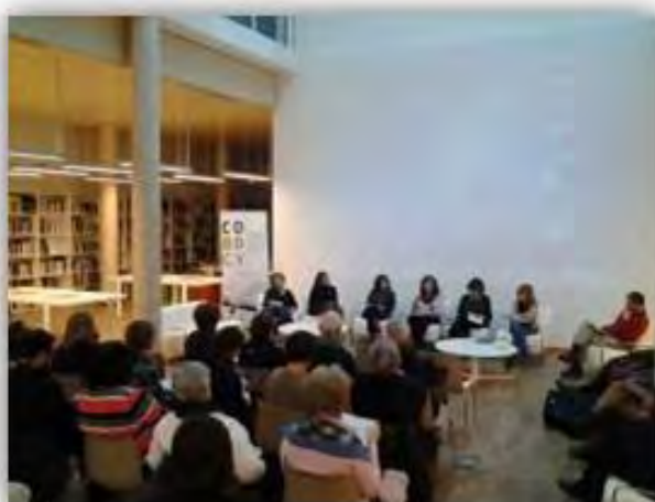
Taula Redona organitzada pel COBDCV. 30 de novembre del 2013. Las Naves

Para comprender el conflicto entre los formatos, soportes y documentos de archivo empezaré por exponer algo menos complejo como es el caso de los archivos fotográficos. Algunas personas han adquirido fotografías, mediante compras o donaciones, generalmente relacionas con un motivo (por ejemplo Valencia) y a ese conjunto de fotografías le han puesto la palabra ‘archivo’, como es el caso del